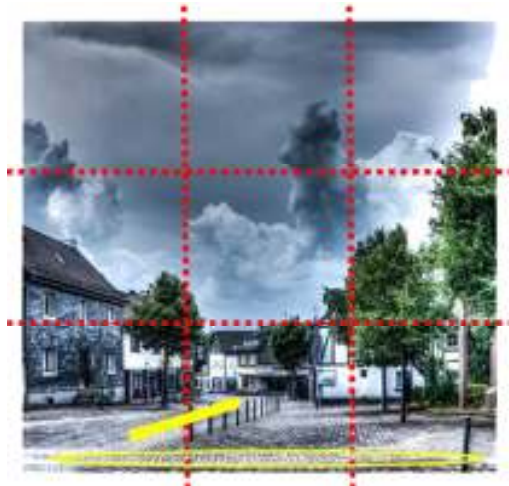
Abbildung 6: Komposition des Motivs

ausgelegt und gehen kaum auf individuelle Szenen ein. Im vorliegenden Fall ist es mir mal - zugegeben mehr zufällig - gelungen (Abbildung 6). Der Himmel nimmt (in der Aufnahmemitte) zwei Drittel des Motivs ein. Akzente der Szene befinden sich nahe der Schnittpunkte der Drittellinien. Im Vordergrund befindet sich mit dem Pflasterweg eine Struktur. Eine perspektivische Linie (Strasse und Pfosten) leitet den Betrachter in das Bild hinein. Dies ist ein unbewusster, aber wesentlicher Grund, warum Betrachter dieses Foto als „toll“ empfinden.