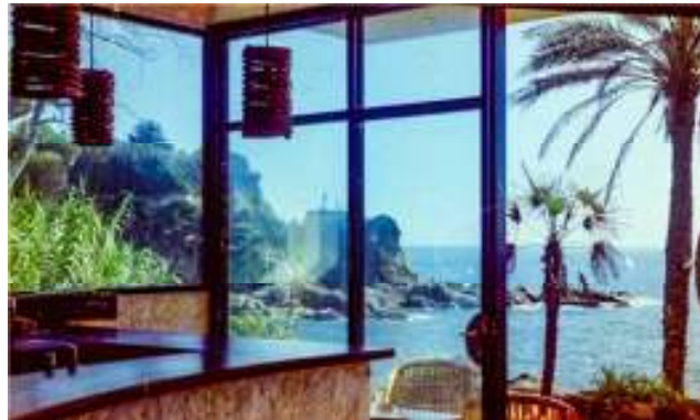
Meine Lieblingsecke in der Bar – Juanita Banana in der Ferne

Engländerinnen sind zumindest damals sehr verschämt. Wenn ein unaufhaltsames Bedürfnis sie auf die Suche schickt, kommen sie oft an die Bar und fragen extrem leise flüsternd „wo ist den das, na sie wissen schon?“ Die Röte eines massiven Sonnenbrandes ist gegen die Röte blass, die der Fragestellerin ins Gesicht schießt, wenn du in lautem Englisch und für die ganze Bar unüberhörbar antwortest: „Das Klo ist hinten rechts!“ Oder die Freundinnenrunde, die kurz vor Schluss