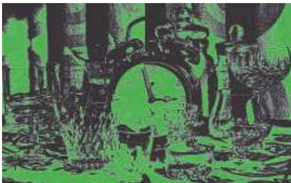
Abbildung 5: Stilleben Wecker mit Gläsern

Fotografie sollte nach meiner Meinung immer die Realität zeigen, so wie ich sie mit meinen Augen sehen kann (oder zumindest wie ich sie subjektiv zu sehen glaube). HDR verfälscht bei richtiger Nutzung nicht die Realität. Schon zu Zeiten des Nasslabors wurde mit extremem Aufwand versucht, die Dynamik einer Szene wiederzugeben. Digital geht dies heute eben viel einfacher.