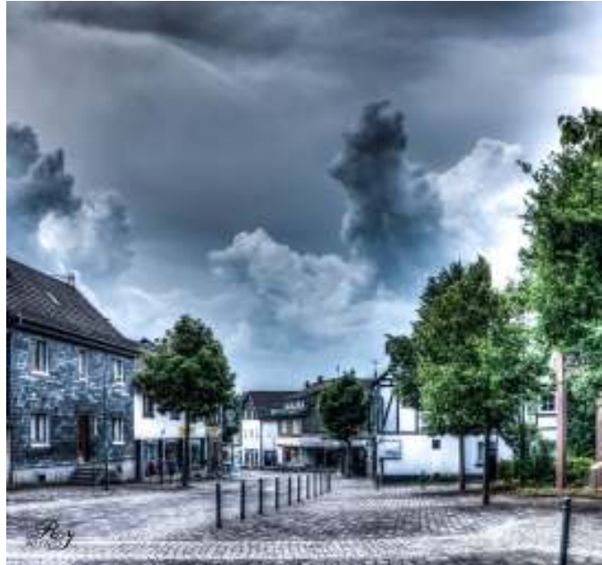
Abbildung 3: HDR mit Photomatix Pro

Mein HDR-Bild entsteht zu Hause am Computer. Ich benutze dazu Photomatix Pro, eine Software, die eine Fülle von Gestaltungsmöglichkeiten beim so genannten Tone Mapping lässt, der Überlagerung der unterschiedlich belichteten Fotos. Ich teste verschiedene Einstellungen und entscheide mich für ein Foto, das mein subjektives Empfinden der eigentümlichen Stimmung vor einem Umwetter am besten widerspiegelt (Abbildung 3).