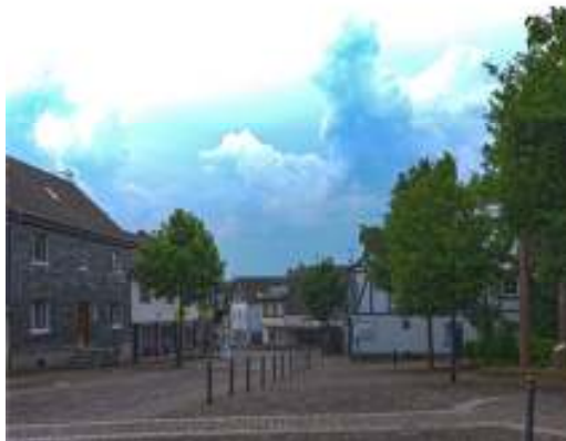
Abbildung 2: HDR mit Automatikfunktion

genauem Hinsehen erkennt man drei Schüler auf dem linken Gehweg.]