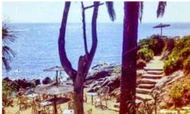
Mittelmeerblick bei einem erfrischenden Drink

Pep ist grosser Jazzfan. Einer seiner Lieblingsmusiker ist Charly Mingus, der eine Sammlung politischer Songs eingespielt hat. Wenn morgens früh um zehn Uhr die Glasschiebetüren zur Eröffnung der Bar auf die Seite geschoben werden und meist noch kein Gast in der Bar ist, dann erschallt aus einer voll aufgedrehten 400-Watt-Musikanlage „A lonely night in Selma, Alabama“ weit übers Mittelmeer. Ich denke mir, Diktatoren sind nicht nur brutal sondern auch dumm. Sie lieben es, sich mit Schergen zu umgeben, die vom Einfluss der Aussenwelt fern- und unwissend gehalten werden. Oder versteht kein Angehöriger der Guardia Civil die Anklage des Refrains „freedom for my brothers, freedom for my sisters, freedom .....!“ Das ist Peps Aufstand gegen die Militärjunta. Ein freies Katalonien innerhalb Spaniens.