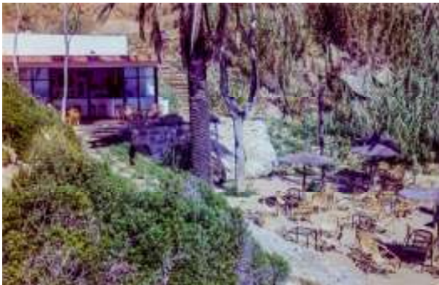
Das alte Gebäude und die Hauptterasse

Gerade habe ich Nachrichten im Radio gehört. Mir gehen ein paar Themen für meine Bergischen Beiträge durch den Kopf: Martin Luther - mangels Wissen unmöglich; Trumps Russlandverbindung - mal abwarten, wie es nach den ersten Anklagen weitergeht; Weltklima - ebenfalls warten, was die Konferenz in Bonn bringt; Jamaika - hatten wir gerade und wird nun wirklich peinlich; Katalonien - warum eigentlich nicht, aber anders im Plauderton über meinen ersten Besuch in dieser spanischen Region. Also dann!