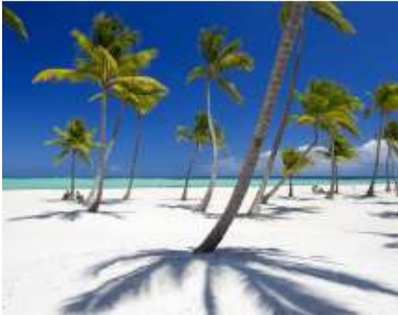
Friedvolle Uckermark (nach Klimawandel)