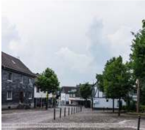
Abbildung 1: Reguläre Belichtung

Wie fast immer habe ich meine "kleine" digitale Systemkamera dabei, eine drei Jahre alte Sony ILCE-5000 mit einem Sony-Zoomobjektiv 16-50 mm (24-75 mm Kleinbildäquivalent). Diese Kamera ist handlich gerade im Alltag, wenn ich nicht auf eine geplante Fototour gehe. Als ich am 22. Juni 2017 gegen 15:30 Uhr auf einem Parkplatz auf der Hochstrasse in Waldbröl auf meine Frau warte, betrachte ich den sich verdunkelnden Himmel. Ich erwarte jeden Augenblick einen Platzregen, wenn nicht sogar die Entladung eines schweren Gewitters. Spontan kommt mir die Idee, die bedrohliche Wolkenformation und das unwirkliche Licht in der Strasse abzubilden. Ich warte, bis die Strasse leer ist. [Stimmt nicht ganz, denn bei