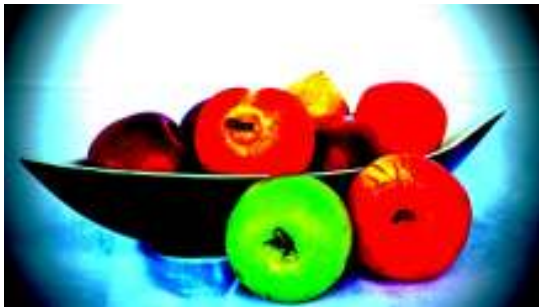
Abbildung 4: Stilleben Obstschale

Manche Fotografen stehen der Nachbearbeitung einer Aufnahme sehr negativ gegenüber. Ich teile diese Auffassung, so lange wir von Fotografie (= Lichtzeichnung) sprechen. Eine